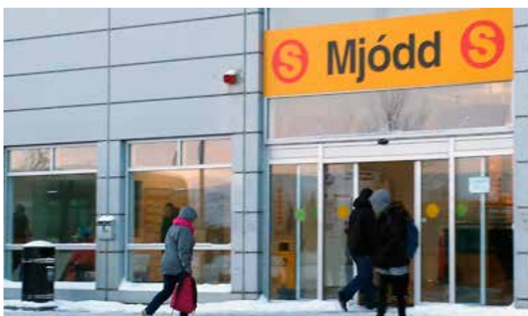
Það var oft kalt að bíða eftir strætó. Sérstaklega eftir að opnunartími hússins var stytur verulega.