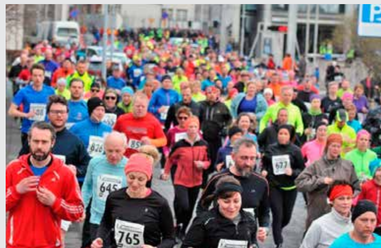
Vonast er til þess að 10 þúsundasti keppandinn taki þátt í hlaupinu í ár, en Víðavangshlaup ÍR hefur verið haldið óslitið í heila öld.

daginn fyrsta, en þá á hlaupið aldarafmæli. Fyrst var hlaupið sumardaginn fyrsta árið 1916 og á enginn íþróttaviðburður hérlendis sér jafn langa samfellda sögu. „Af þessum