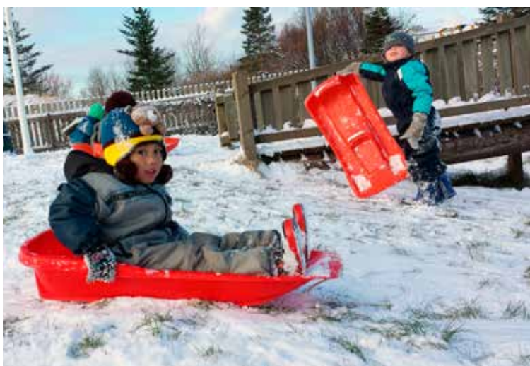
Enda þótt ekki væri mikið af snjónum þarna í upphafi.