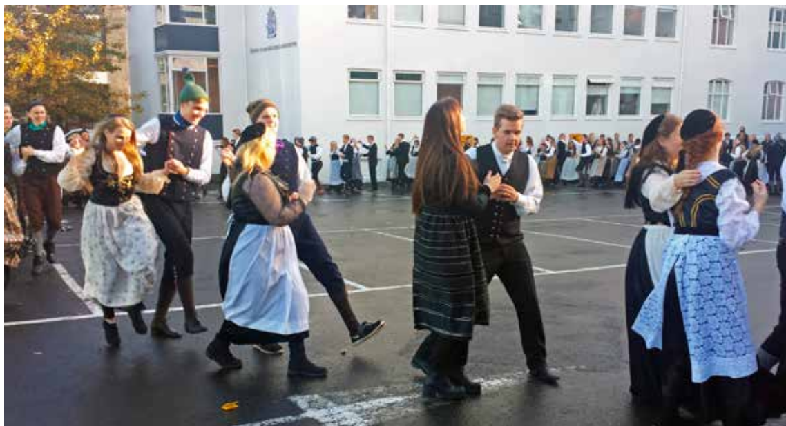
Skólanemendur dönsuðu fyrir starfsfólk menntamálaráðuneytisins, skömmu áður en fyrsti snjórinn 'sýndi sig í fyrrahaust.