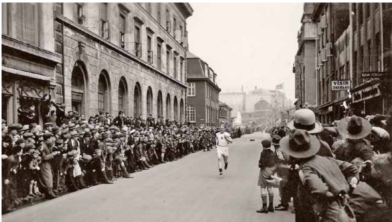
Hlaupið í mark í Víðavangshlaupi ÍR. Þessi mynd er tekin í Austurstræti líklega á árunum 1936-8. Víðavangshlaup ÍR verður hlaupið í 100. sinn, sumardaginn fyrsta, en enginn íþróttaviðburður hérlandis á sér jafn langa óslitna sögu. Sjá bls. 2.

Sjálfstæðismenn á Seltjarnarnesi héldu dómsmáli leyndu fyrir minnihlutunum: