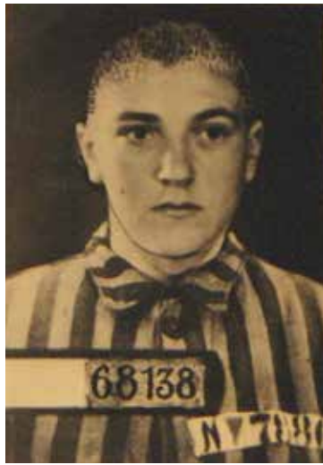
Fangi 68138, mynd af Leif úr spjaldskrá Sachsenhausen-fangabúðana.

Seinni heimstýrjöldin hafði afdrifarík áhrif á Íslendinga. Því fylgdu efna-hagsleg umsvif ólík því sem áður höfðu sést og nánari tengsl við umheiminn en áður. Styrjöldin markar upphaf svo margt í sögu okkar. Þrátt fyrir það er íslenska söguminnið svo brenglað. Við þekkjum „ástandið“ og höfum í flimtingum en þekkjum ekki persónunjósnirnar og ofsókninar sem ástandinu fylgdi. Rannsóknir á þessu eiga sér stað á okkar dögum. Við ræðum ekki stríðsgróðamennina