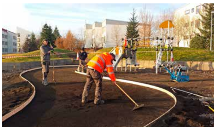
Leikvöllur lagður í lok september.