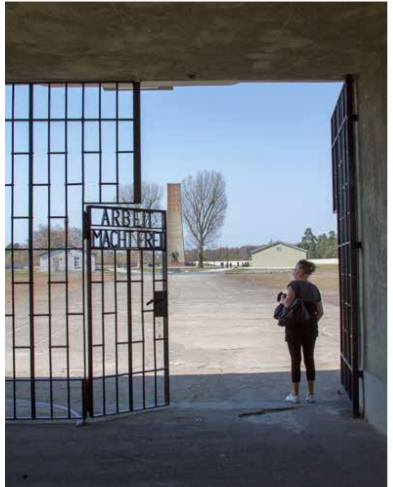
Vinnan gerir ykkur frjáls, alræmdustu orð útrýmingabúða nasista. Myndin er tekin við inngang Sachsenhausen.

Við tölum ekki um íslensku nasistana, krefjumst ekki yfirbóta eða jafnvel heiðarlegri umræðu fyrir mína kynslóð