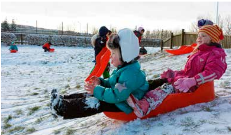
Krakkarnir þurftu litla hvatningu þegar fyrsti snjórinn féll.