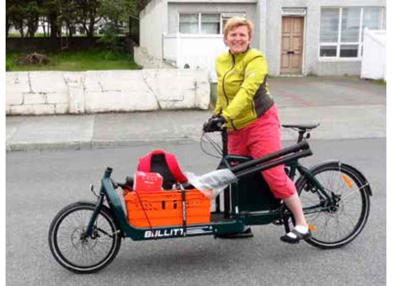
Pakkahjól eru frábær í innkaupin og henta vel til minni snúninga í þéttbýli

Búðareigendur ættu að sjá hag sinn í að taka vel á móti hjólandi viðskiptavinum því sá sem er á hjóli, er líklegri til að koma oftar í búðina og taka oftar með sér heim ferskvöru en sá sem fer sjaldnar. Góð hjólastæði eru mikil-