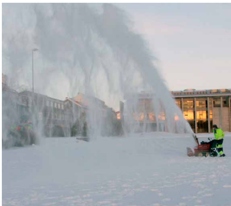
Og það mátti líka reyna að slétta ísinn á tjörninni.