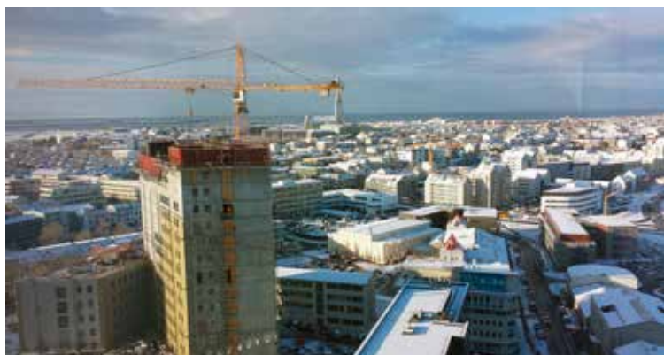
Fyrsti snjór vetrarins á húspökum í október.