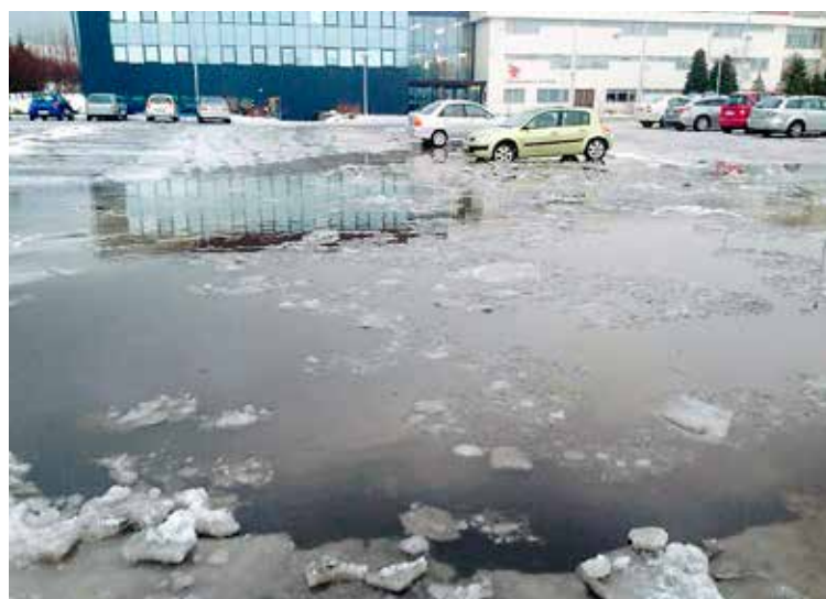
Svona var umhorfs við Breiðholtslaug fyrir örfáum vikum.