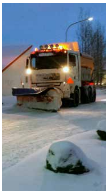
Algengt sjón í vetur.