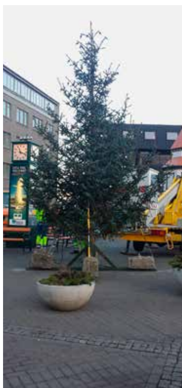
Svo varð nú snjólaust í nokkurn tíma.