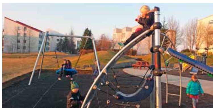
Fallegt haust við leikvöll í Breiðholti, en endurbættur völlur var tekinn í notkun í byrjun október.