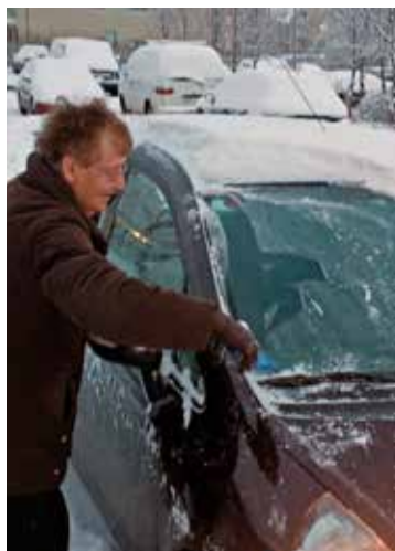
Algengt verk í vetur.