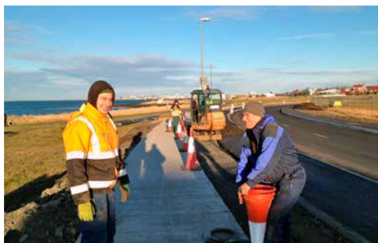
Hjólástigur lagður í Skerjafirði í lok september.