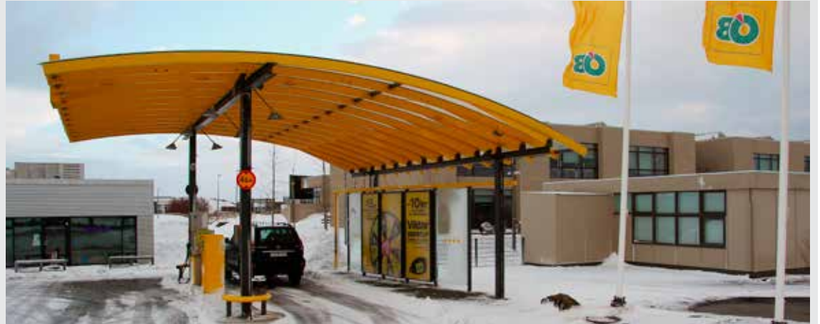
Hér má sjá bensínstöðina í forgrunni. Vinstra megin má sjá fristundaheimilið Fókus sem er í bárujárnshúsinu. Grái skúrinn hægra megin við bensínstöðina er færarleg kennslustofa við skólann og þar að baki er aðalbygging Ingunnarskóla.

hann fékk samþykka í skóla og frístundaráði árið 2012 um að flutningur bensínstöðvarinnar yrði kannaður. „Árum saman hafa foreldrar barna í Ingunnarskóla gert athugasemdir við staðsetningu stöðvarinnar svo nærri fjölmennasta skóla hverfisins og m.a. kvartað yfir því að í ákveðnum vindáttum berist benzínfnykur inn í skólahúsnæðið,“ segir meðal annars í tillögunni. Þarna er bensínstöðin þó enn. Enn finnst lyktin og íbúar ræða hvaða leiðir séu færar í málinu.