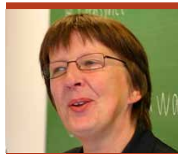
Höfundur er J. Bryndís Helgadóttir, framhaldsskólakennari

Þarna er komið að kjarna málsins. Hvað með jafnréttissjónarmiðin og lögvarinn rétt almennings og eins ef ekki er gengið út frá reglum og starfskilyrðum þá getur komið til árekstra á milli þessara tveggja rekstrarforma, því öllum, sem þess þurfa, skal tryggður í lögum réttur til aðstoðar vegna sjú-