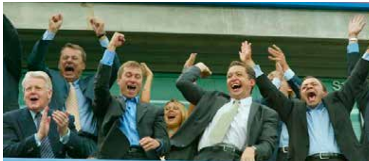
Forsetinn á vellinum ásamt rússneskum auðmanni og fleirum.

nokkra aðstöðu, hversu veik sem hún kann að vera, til að hafa áhrif á þjóðarleiðtoga. Þessar reglur ættu í raun að gilda í hvítvetna, líka um yfirmenn stofnana, þingmenn og ráðherra. Líkt og reglan um hámarksupphæð gjafa.“