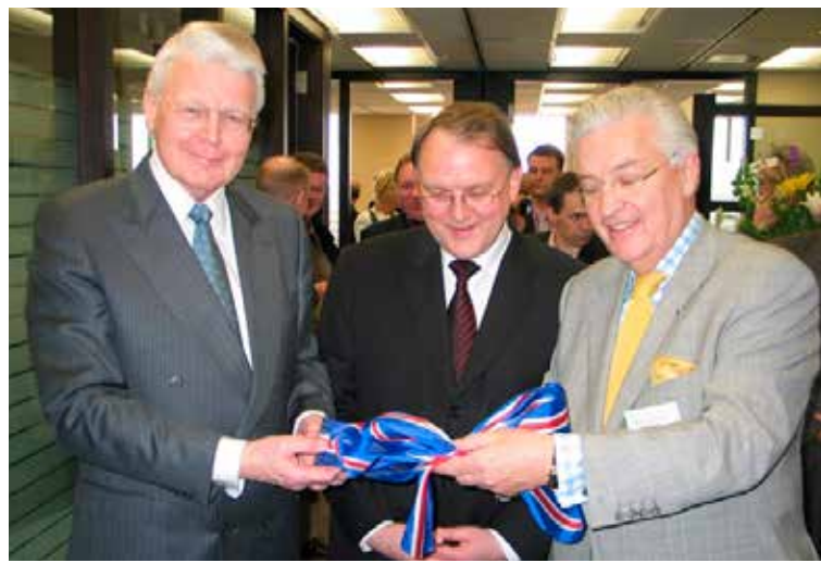
Forsetinn í Kanada ásamt forsvarsmönnum Landsbankans sáluga.

Það er hins vegar algerlega fráleitt að einkaaðilar „sponsi“ forseta landsins og að mínu mati er ómögulegt að gera undantekningu á þeirri grundvallarreglu. Hér er um að ræða æðsta embætti þjóðarinnar og það er einfaldlega ekki í boði að einkaaðilar komist í