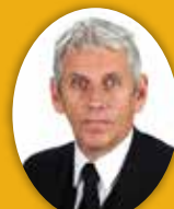
Guðmundur Baldvinsson útfararþjónusta