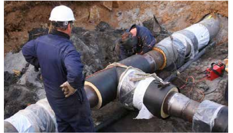
Starfsmenn HS veitna vinna við hitaveitulögn.

Samkeppnisfirlitið er að sögn að fara yfir viðskiptin og segjast aðilar málsins ekki munu ræða það frekar fyrr en að þeirri skoðun lokinni.