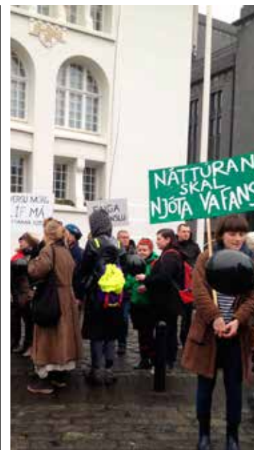
Hópur fólks mótmælti þegar skrifað var undir sérleyfi um olíuvinnslu.

„Í teoríu er þetta góð leið til að senda