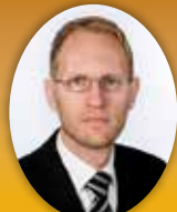
Frímann Andrésson útfararþjónusta