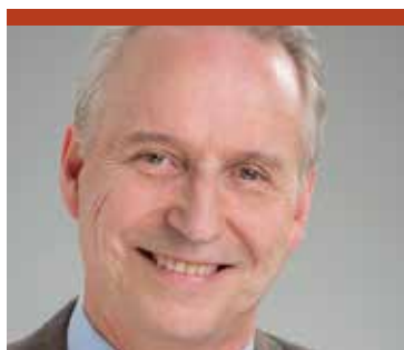
Höfundur er Ari Trausti Guðmundsson jarðvísindamaður og rithöfundur

í tilteknum miðbæ heldur á því að heimamenn leiða borgarhlutann að mestu hjá sér. Hann verður að uppsettri leikmynd, fjarri venjulegu og fjölbreyttu borgarlífi. Íbúðarhús verða gististaðir, hótél standa í röðum, sum hálfót, meirihluti verslana höfðar ekki lengur til heimamanna, afþreying er ýmist stöðluð eða beinist nær eingöngu að ferðamönnum og gríðarlegur fjöldi veitingastaða og kráa safnast fyrir á litlu svæði, miðað við fjölda viðskiptavina. Fjöldi fyrirtækja birtist hratt og hverfur álika fljótt af því að efnahagsgrunnurinn er of veikur. Á öðrum stöðum er jafnan örtröð. Mörg fyrirtæki og stofnanir sem almenningur á erindi við flytjast til annarra hverfa. Auðvitað eru víða athyglisverð fyrirtæki í allri flórunni og margir ná árangri í viðskiptum en heildarþróunin er samt sú sem æ fleiri hafa orð á og mislíkar.