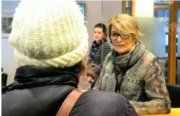
Óbreyttur starfsmaður innanríkisráðuneytisins tekur við áskorun mótmælenda um að ráðherra viki.

Gagnrýni starfsmanna á rannsókn rekstrarfélagsins var að sögn svarað af