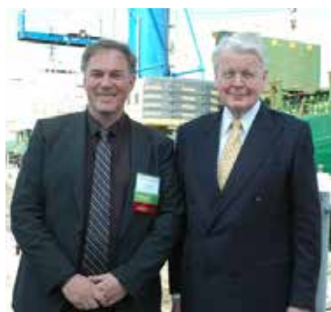
Eimskips og forsetinn í Portland í fyrrasumar.

„Nei. Ég tel rétt að forsetinn sem og aðrir opinberir embættismenn forðist allar slíkar tengingar við einkaaðila. Til þess að tryggja trúverðugleika stjórnsýslunnar er mjög mikilvægt að það fólk sem gegnir opinberum embættum leggi sig í líma við að forðast allt það sem hægt er að sjá sem