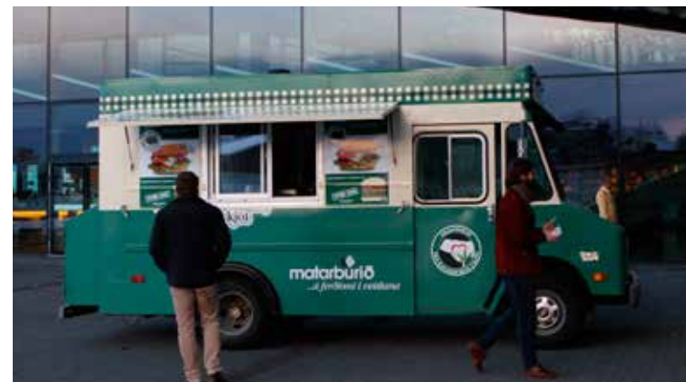
Bylting sem er að verða í matvælaframleiðslu og neysluháttum virðist vera að fara framhjá stórum matvælafyrirtækjum og ráðamönnum.

Að baki þessum matarmarkaði standa ostasérfræðingurinn Eirný Sigurðar-