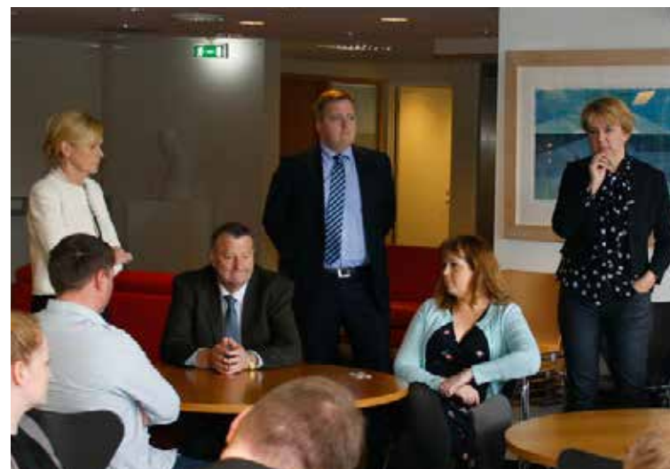
Sigmundur Davíð Gunnlaugsson verður dómsmálaráðherra, ásamt því að fara með forsætisráðuneytið.