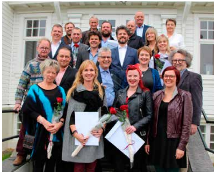
Verðlaunahafar ásamt fleirum á tröppunum við Höfða.

Dunhagi 11-17 og Ljósheimar 8-12 fengu viðurkenningu fyrir fjölbýlishúsaloðir. Þá voru húsin Hannesarholt að Grundarstíg 10, Lækjargata átta og hús HB Granda við Grandagarð 20 verðlaunuð sérstaklega. Þá var umhverfi við Laugaveg 1 þar sem verslunin Visir er til húsa og Skólavörðustígur 5 einnig verðlaunuð fyrir aðstöðu sína við sumargöturnar.