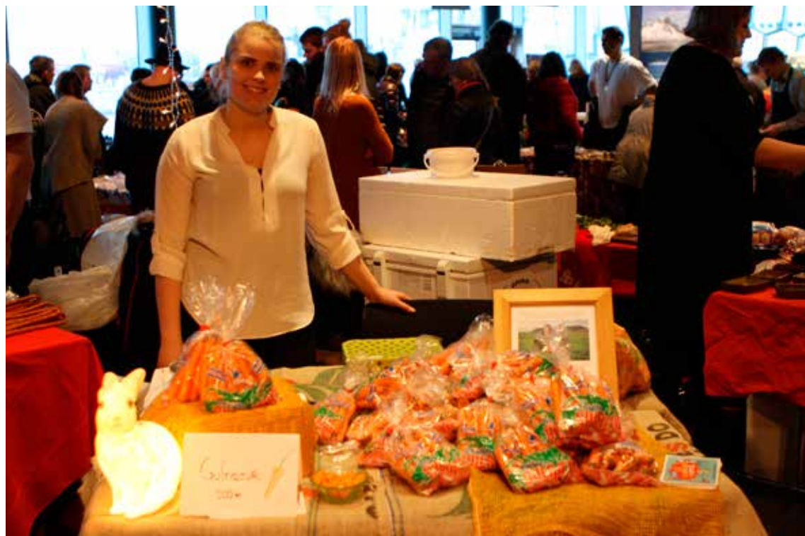
Sjaldan ef nokkurn tímann koma jafn margir í Hörpuna og þegar boðið er upp á mat. En er til eitthvað sem heitir íslensk matarstefna?

Ísland er matarland. Það sem við kunnum er að framleiða mat. Hér eru gríðarlega sóknarfæri á þessu sviði. Svíar ákváðu fyrir fáeinum árum að gera sérstakt átak sem heitir Matarlandið Svíþjóð. Þar í landi breyttu menn lögum og reglum og rýmkuðu á alla lund svo mati yrði gert hærra undir höfði. Menn settu líka peninga í að framfylgja stefnunni. Árangurinn hefur skilað sér í fleiri og betri veitingastöðum, fjölbreyttari framleiðslu, meiri útflutningi á mat með meiri gjaldyristekjum, heilbrigðari þjóð með minni útgjöldum fyrir ríkissjóð, fjölbreyttari menningu og auknum straumi matarferðamanna til Svíþjóðar. Alþjóðlegar rannsóknir sýna að matarferðamenn eyða meiru, dvelja lengur og eru betri auglýsing fyrir landið sem þeir heimsækja en flestir aðrir. Hvar er matarstefna Íslands? Það skal ég segja ykkur. Hún er ekki til!