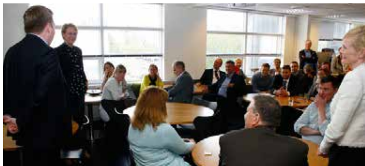
Starfsmenn munu áfram hafa aðstöðu í húsnæði innanríkisráðuneytisins þar sem Hanna Birna Kristjánsdóttir fer með mannaforráð.