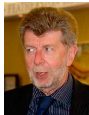
Maurice Williamson sagði af sér ráðherraembætti á Nýja-Sjálandi eftir afskipti af lögreglurannsókn.

Hér á landi, í tilfalli Hönnu Birnu, höfum við jafnvel skýrara dæmi um tilraun til að hafa áhrif á rannsókn mála. Þar hefur ráðherra ekki aðeins orðið uppvis að afskiptum af lögreglurannsókn heldur afskiptum á öllum stigum málsins. Í lekamálinu hefur ráðherra verið staðin að afskiptum af fjölmiðlaumfjöllun og af fulltrúum löggjafans á Alþingi. Vefur ráðuneyt-